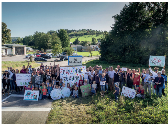
Das Foto wurde im September 2019 und somit vor der Corona-Krise gemacht!

Im September 2019 rief in Bad Schallerbach erstmals eine Gruppe von Schallerbachern auf, im Sinne der „Fridays-For-Future-Bewegung“ mit einem Foto vor dem Ortschild von Bad Schallerbach auf die Ziele des Pariser Klimaschutzabkommens aufmerksam zu machen.